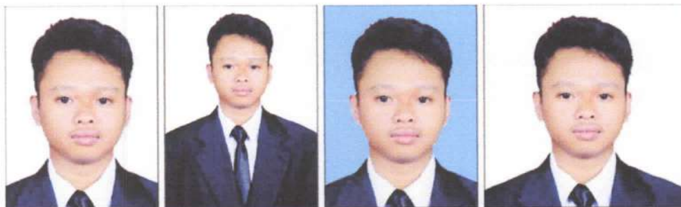
BENAR Latar putih, ukuran 3x4 dan wajah jelas.