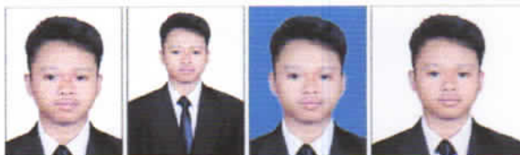
BENAR Latar putih, ukuran 3x4 dan wajah jelas.