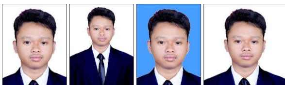
BENAR Latar putih, ukuran 3x4 dan wajah jelas.