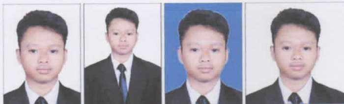
BENAR Latar putih, ukuran 3x4 dan wajah jelas.