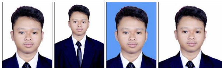
BENAR Latar putih, ukuran 3x4 dan wajah jelas.